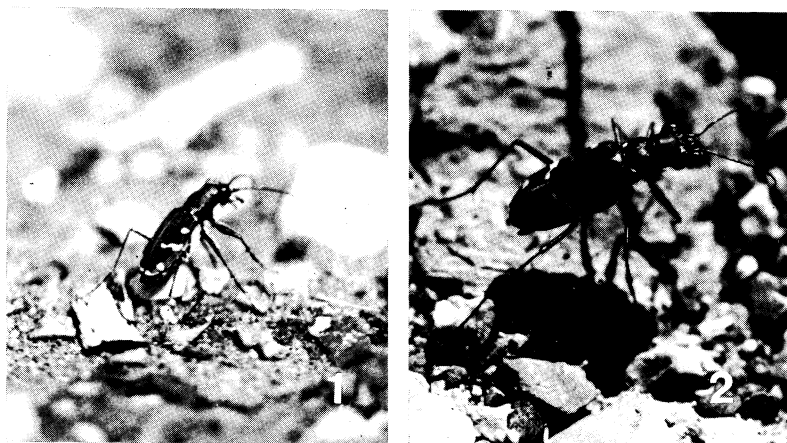
写真1 Cicindela japon MOTSCHULSKY ニワハンミョウ