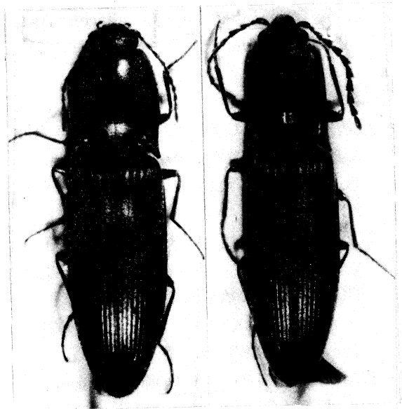
ツヤケシフトヒラタコメツキの雄(左)(体長9mm)と雌(右)(体長13.5mm)濁河温泉産.

頭部の前頭横隆線の中央部は強く抑圧されて不明瞭, 触角は比較的短く, 末端は前胸背板の後角よりやや長い程度. 第2節は短小で幅と長さにはほぼ等しく, 第3節から鋸歯状で, 第3節は第4節よりやや短い. 前胸背板は矩形で幅より長く, 両側は細く縁取られる. 背面は膨隆するが, 正中部は平滑線を有しない. しかし, 正中部の基部近くは凹溝状を呈する. 前胸背板の後角背面の